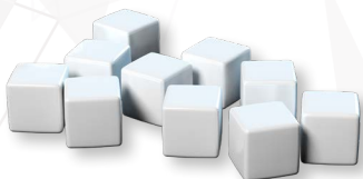
12 больших белых маркеров