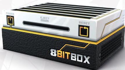
1 игровая приставка