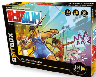
1 игра «СТАДИОН»