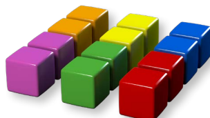
18 цветных маркеров (по 3 маркера шести цветов)