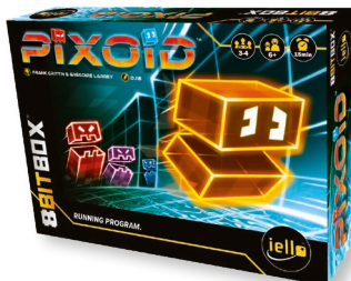
1 игра «ПИКСОИД»