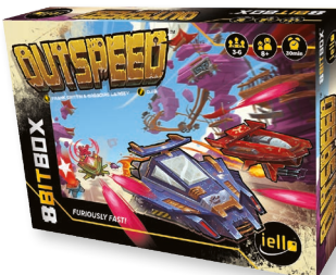
1 игра «СКОРОСТЬ»