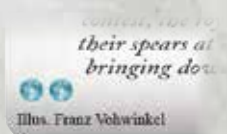
Карта с Показателем Лун равным «2»

Строя колоду, если игрок добавляет карты не принадлежащие его лидеру, общий показатель лун этих карт не может превысить допустимый предел на этой карте лидера и карте инквизитора (см. «Инквизиторы»). Не-принадлежащая карта с тем же самым индикатором колоды, что и карта лидера игрока включается в этот предел.