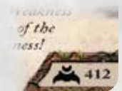
Символ Принадлежности Инквизитора

Игрок помещает свою карту инквизитора в свою область лидера вместе с картой лидера во время шага 3 установки.