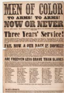
Плакат, призывающий цветных мужчин записаться в армию США, после издания «Прокламация об освобождении рабов» в 1863 году.