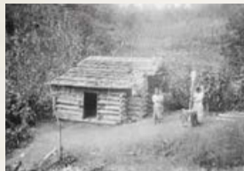
Традиционный дом индейцев чероки, XIX век

О свободе им стало известно только после окончания Гражданской войны 19 июня 1865 года, когда афроамериканские солдаты оккупировали Техас. Басс Ривз стал самым известным помощником маршала, работавшим на индейских территориях. Он служил с 1875 по 1907 год, дольше любого другого маршала