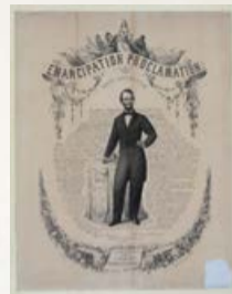
Копия прокламации об освобождении, подписанная А. Линкольном, 1864 год

Басс Ривз стал легендой ещё при жизни; о «Невидимом маршале» даже слагали песни. Непревзойдённые навыки маскировки, потрясающее умение обращаться с любыми видами оружия стали темами многих историй. Басс мог поймать преступников там, куда другие блюстители закона даже не смели сунуться. Ривз закончил свою карьеру в правоохранительных органах Маскоги, штат Оклахома, где проработал полицейским около двух лет. Басс умер от нефрита 12 января 1910 года и похоронен в Маскоги. Его помнят как одного из величайших служителей закона в истории США.