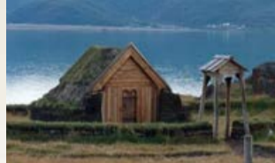
Копия небольшой христианской церкви в Братталиде, Гренландия (на месте поселения Эрика Рыжего).

Путешествие в Винланд было не последним для Гудрид. Через некоторое время она вернулась в Исландию, а затем совершила большое путешествие в Рим. После она вернулась в Исландию и жила отшельницей. Её сын Снорри выстроил для неё церковь.