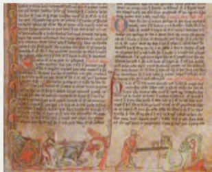
Отрывок из иллюстрированной саги (XIII век)

Они рассказывают о путешествиях в поисках Винланда, предпринятых детьми Эрика Рыжего, а также Торфинном Карлсефни. Эти две саги, написанные более чем через 200 лет после описываемых событий, различаются по ряду моментов, но сходятся