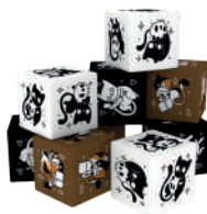
15 кубиков котиков (3 коричневых, 6 чёрных, 6 белых)