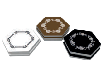
9 жетонов областей (3 коричневых, 3 чёрных, 3 белых)