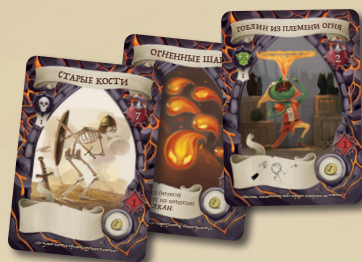
21 КАРТА МОНСТРОВ