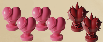
4 ФИШКИ ЗДОРОВЬЯ ГЕРОЕВ 2 ФИШКИ ЗДОРОВЬЯ МОНСТРА