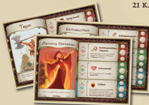
4 ПЛАНШЕТА ГЕРОЕВ