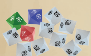
12 ВОСЬМИГРАННЫХ КУБИКОВ (3 ЦВЕТНЫХ + 9 БЕЛЫХ БОНУСНЫХ)