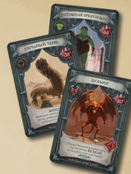
3 КАРТЫ БОССОВ