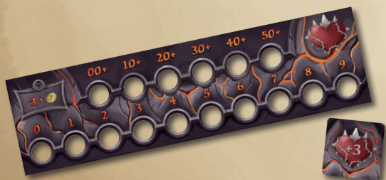
ШКАЛА ЖИВУЧЕСТИ МОНСТРА ЖЕТОН РЕЖИМА СЛОЖНОСТИ