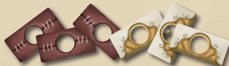
12 ЖЕТОНОВ ШРАМОВ / УЛУЧШЕННЫХ СПОСОБНОСТЕЙ