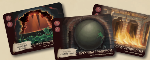
21 КАРТА ПОДЗЕМЕЛЬЯ