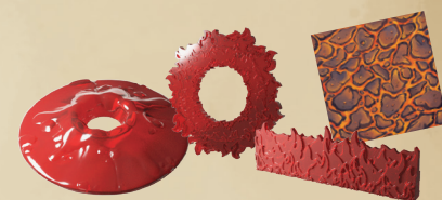
1 ВУЛКАН, 1 КОЛЬЦО ОГНЯ, 1 СТЕНА ОГНЯ, 1 ЛАВОВЫЙ КОВЁР