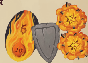
4 НАКЛАДКИ (1 ШАР ОГНЯ, 1 БРОНЯ, 2 ВЗРЫВА)