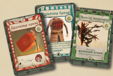
24 КАРТЫ СНАРЯЖЕНИЯ