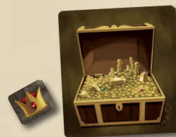
ЖЕТОН ВОЖАКА ЖЕТОН СУНДУКА