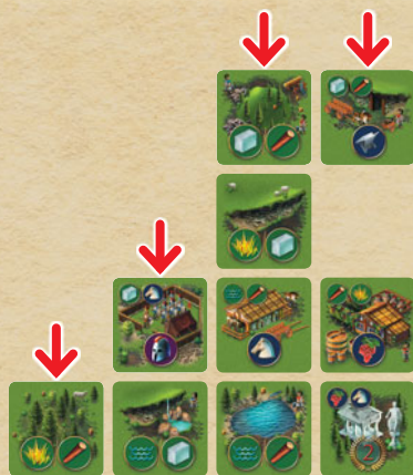
Незащищённые квадраты показаны стрелками.