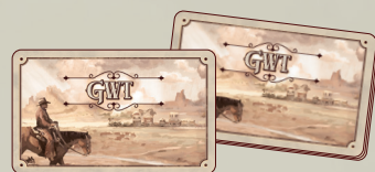
15 карточек Сэма