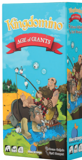
Дополнение Век великанов