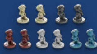
10 рабочих (2 x 5 цветов)