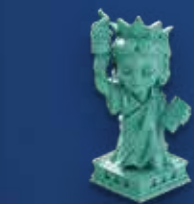
1 Статуя Свободы