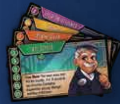
14 Справочных карт