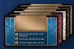
5 Цветных карт игроков