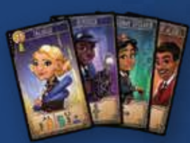
85 Карт ролей