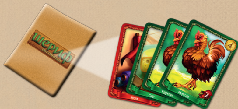
Товары в мешке