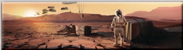
«Поставка снабжения» (Гарретт Каида)

Этот вариант игры можно использовать с любыми дополнениями. Теперь, вместо того, чтобы увеличивать глобальные параметры, ваша цель — повысить свой РТ до 63 ед. за 14 поколений (или за 12, если вы играете с картами прологов). Пометьте 63-е деление золотым кубиком. В этом варианте игры добавляется новый стандартный проект «Буферный газ», который стоит 16 М€ и повышает ваш РТ на 1. В остальном действуют обычные правила игры в одиночку.