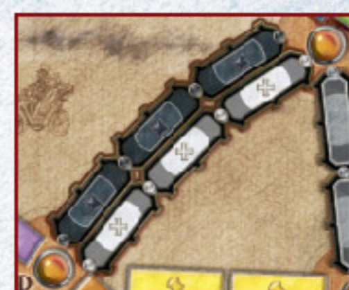
Двойная туннельная линия (чёрно-белая) между Мадридом и Памплоной.

В редких случаях, когда ни в колоде, ни в сбросе нет трёх карт, вскройте только те, что остались. Если из-за скопления карт на руках у игроков и колода, и сброс пусты, туннель можно пройти без всякого риска, как обычный перегон.