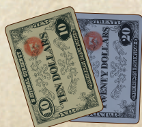
54 карты денег (36 по $10, 18 по $20)