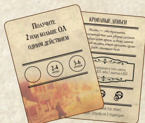
40 карт сюжетов