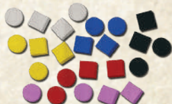
12 маркеров очков 12 маркеров сюжетов