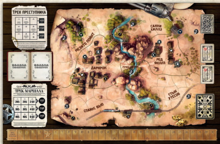
1 игровое поле