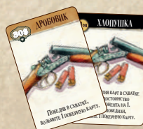
54 карты предметов: скакуны, оружие и пожитки