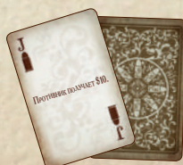
13 боевых карт