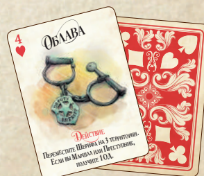
52 покерные карты