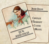
48 карт целей (по 4 на персонажа)