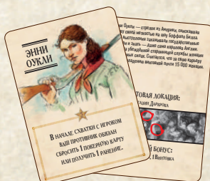
12 карт персонажей