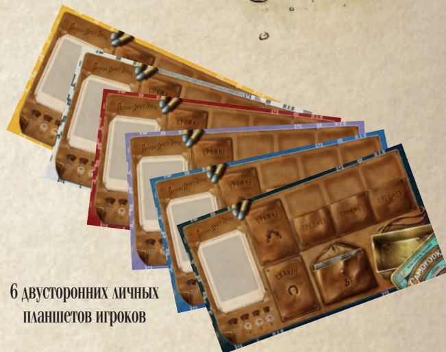
6 двусторонних личных планшетов игроков