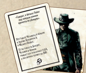
11 карт Человека в чёрном