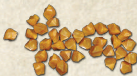
36 золотых самородков