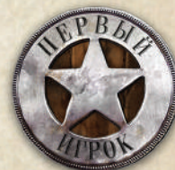
1 жетон первого игрока